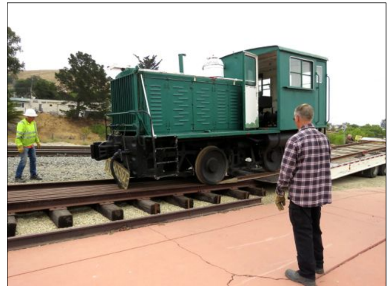
No 2038 entregado a la vía de exhibición del Museo del Ferrocarril de San Luis Obispo en 2018.